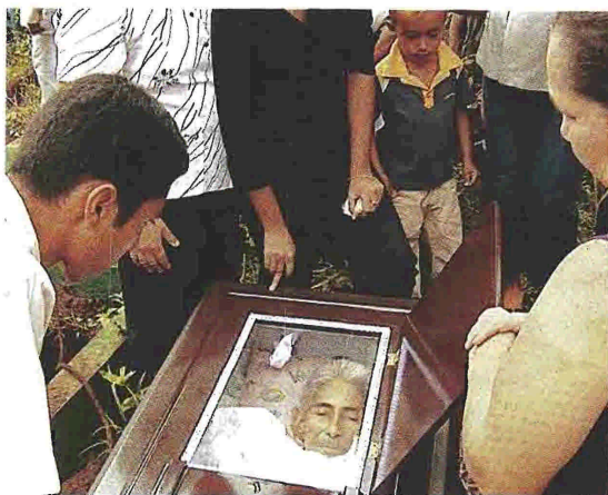
Σκηνή από το ντοκιμαντέρ «Μπανάνες» που καταγγέλλει ότι εργάτες της εταιρείας Dole πεθαίνουν από καρκίνο

Το Φεστιβάλ Ecofilms, που γίνεται στο «νησί των ιππο-