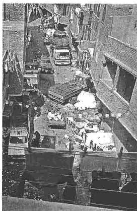
«Garbage dreams»: τρεις έφηβοι επιβιώνουν ανακυκλώνοντας τα σκουπίδια του Καίρου

άγνωστη παρενέργεια της υπερθέρμανσης του πλανήτη που μας απειλεί σοβαρά... ★ «Garbage dreams» της Μάι Ισκαντέρ (20 Ιανουαρίου). Τρεις έφηβοι, γεννημένοι κυριολεκτικά μέσα στα σκουπίδια στα πρόσωπα του Καίρου, επιβιώνουν ανακυκλώνοντας το 80% των απορριμμάτων